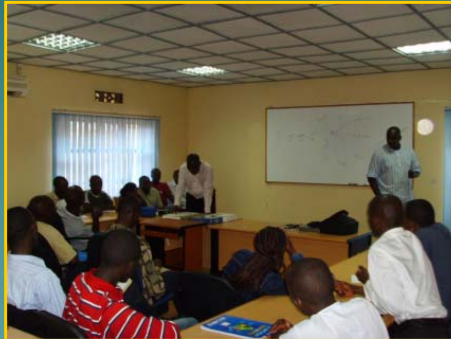
Visite Guidée en Entreprise (RWANDATEL)