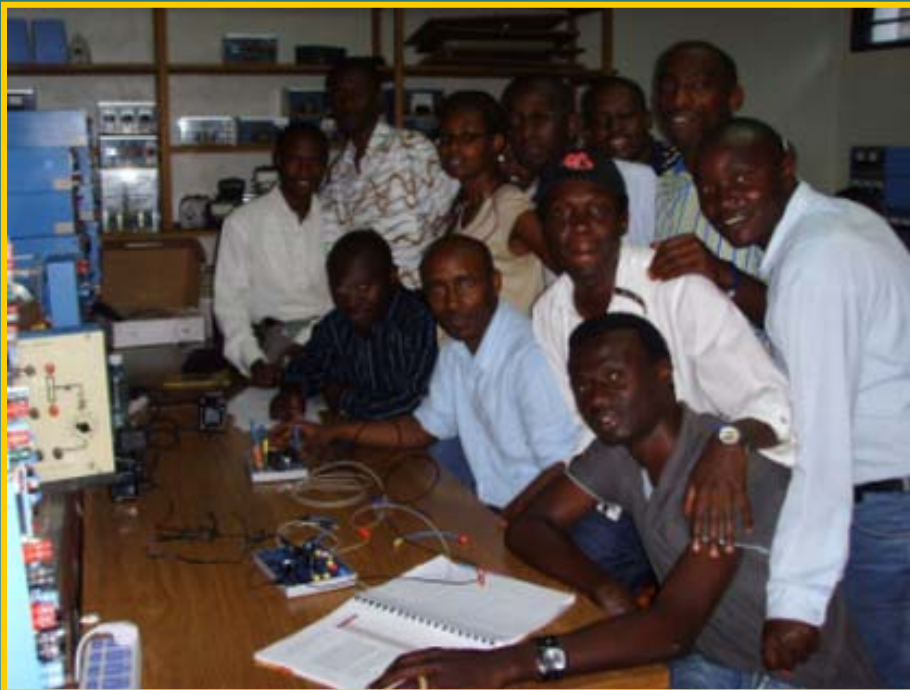
Travaux Pratiques Réalisés Grâce à au Soutien du Programme MIDA

MISSION de soutien au corps enseignant: Faculté des Sciences Appliquées/ Electronique et Télécommunications